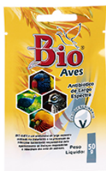
BIO AVES 50GR