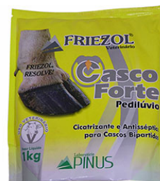
CASCO FORTE PEDILUVIO FRIEZOL 1KG