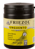
UNGUENTO FRIEZOL 250G