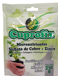
CUPROFIX PO 250GR