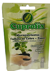
CUPROFIX PO 30GR