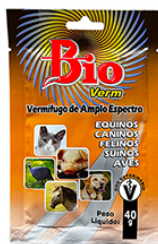
BIO VERM 40G