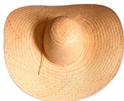
CHAPEU CARANDA P.F AR ABA 15