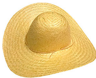
CHAPEU CARANDA P.G AR ABA 12