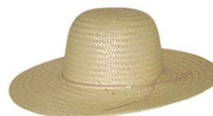
CHAPEU PANTANEIRO P.F AR ABA 10