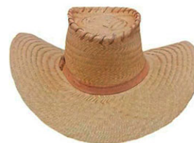
CHAPEU CARANDA P.F AR C/F COURO ABA 10