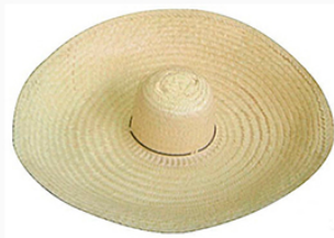
CHAPEU GIGANTE P.GR TI S/AR CORDAO ABA 20 A 25