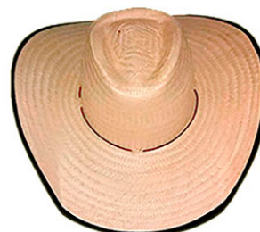
CHAPEU CARANDA P.F AR ABA 12 VIES