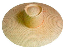
CHAPEU PANAMA ESP. P.EF S/AR ABA 16