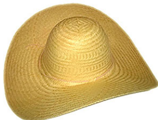
CHAPEU CARANDA P.F AR ABA 12