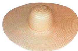
CHAPEU PANTANEIRO ESP. P.F S/AR ABA 15