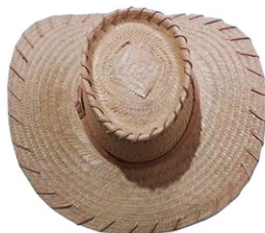
CHAPEU CARANDA P.F AR C/A/F COURO ABA 10