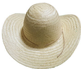
CHAPEU CARANDA P.F AR ABA 07 INF