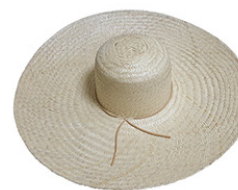
CHAPEU GIGANTINHO P.EF S/AR ABA 15 A 17